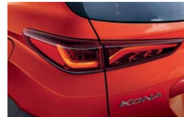
Đèn hậu dạng LED 3D