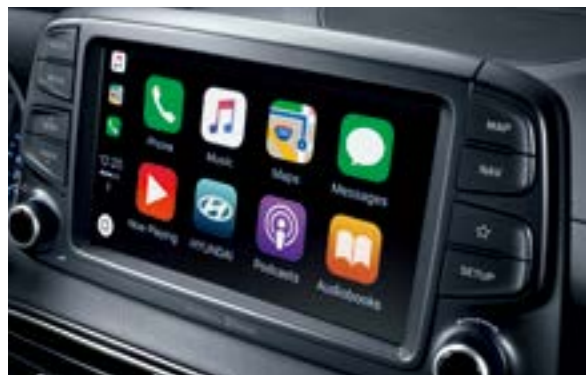
Màn hình cảm ứng 8 inch tích hợp Apple Carplay & Hệ thống định vị dẫn đường