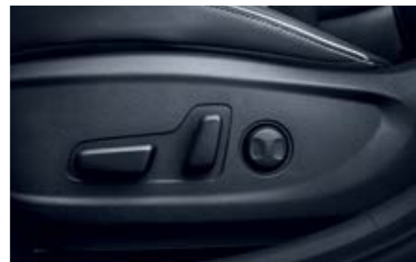
Ghế lái điều chỉnh điện 10 hướng