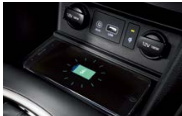
Sạc không dây chuẩn Qi