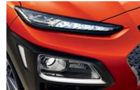
Đèn chiếu sáng Bi-LED cho 2 chế độ pha-cos