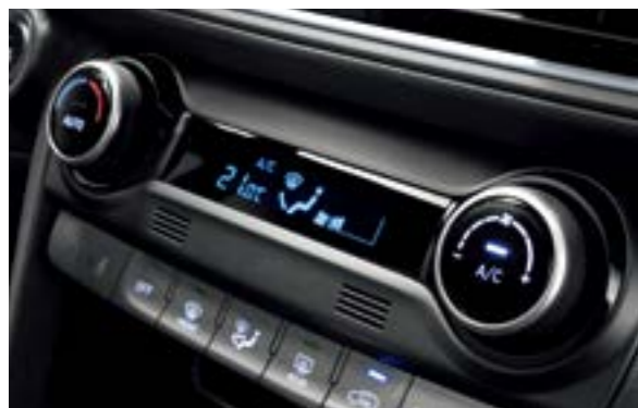
Điều hòa tự động tích hợp khử ion