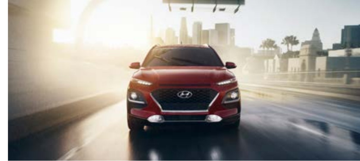
Lưới tản nhiệt thác nước Cascading Grill với các cụm đèn riêng biệt

Kết hợp các đường nét thiết kế táo bạo không kém phần tinh tế, Hyundai Kona tạo nên vẻ gợi cảm từ mọi góc nhìn. Các đường nét góc cạnh kết hợp cùng những chi tiết tạo khối ấn tượng tạo nên một thiết kế SUV mạnh mẽ. Lazang 18 inch Diamond-Cut cùng lựa chọn màu sắc cá tính nổi bật, giúp bạn khẳng định phong cách đậm khác biệt của bản thân.