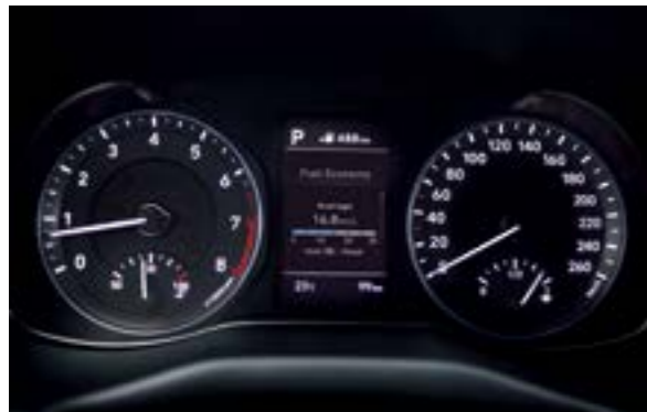
Màn hình thông tin đa chức năng 3,5 inch

Với mức độ hoàn thiện cao, chú ý đến từng chi tiết, Hyundai Kona sở hữu nội thất rộng rãi, tiện nghi và tinh tế. Những điểm nhấn về công nghệ và tính năng giúp bạn có thể cá nhân hóa không gian nội thất trở nên cá tính và độc đáo hơn.