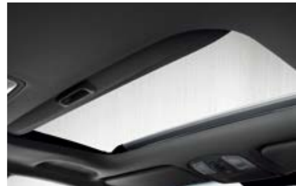
Cửa sổ trời