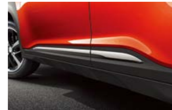
Ốp gầm thể thao