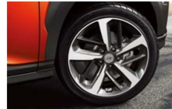
Lazang 18 inch Diamond-Cut