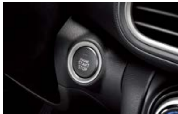
Chìa khóa thông minh kết hợp khởi động nút bấm