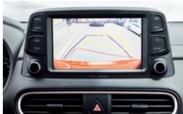
Camera lùi tích hợp