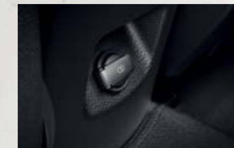
Cổng USB hàng ghế sau