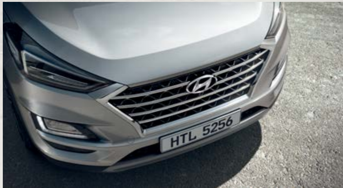
Lưới tản nhiệt dạng thác nước Cascading Grill ấn tượng