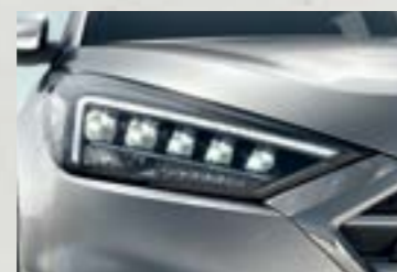
Cụm đèn pha Full LED mạnh mẽ