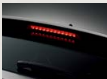
Đèn phanh trên cao