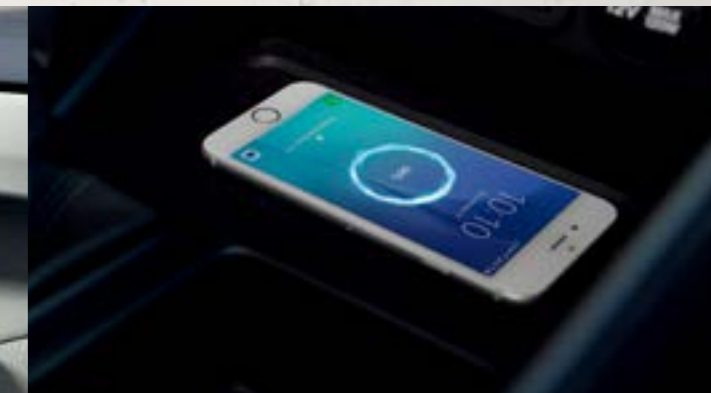
Sạc điện thoại không dây chuẩn Qi