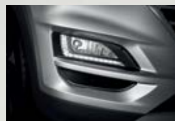
Dải đèn LED ban ngày sắc sảo