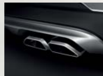
Ống xả kép