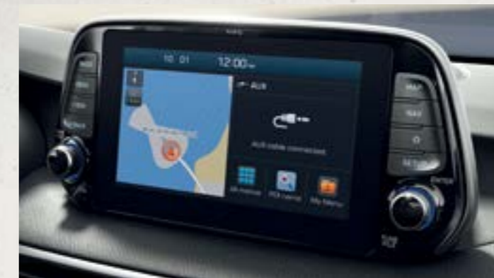
Màn hình cảm ứng 8 inch

Không gian nội thất rộng rãi và công nghệ tiện nghi bên trong chiếc xe Hyundai Tucson có thể đáp ứng mọi nhu cầu và sở thích của bạn