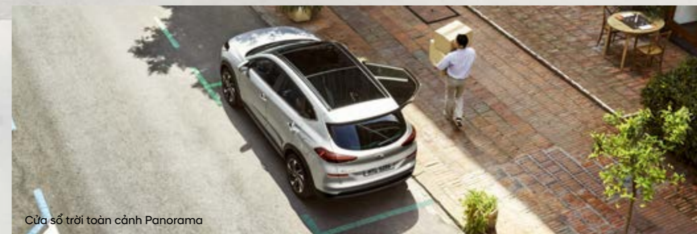
Cửa sổ trời toàn cảnh Panorama